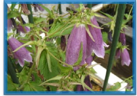
ほたる館で羽化したゲンジボタル(左)とホタルブクロ(右)の写眞です。