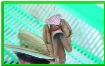
よく見ると意外とかわいい？