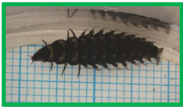
大きく育ったゲンジボタルの幼虫

3月後半になると、水の中でくらしていたホタルの幼虫は土の中で蛹になるために上陸をはじめます。最近はずいぶん暖かくなってきて、春の訪れを感じますね。