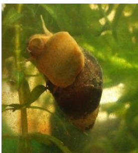
カワニナ (ホタルのエサ)