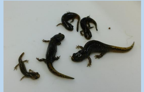
上陸したカスミサンショウウオの幼体

最近研究が進み九州にしかいないということが分かりました。ホタル並みに希少な生き物です。卵、幼生は水場に暮らしますが、幼体と呼ばれるくらいに大きくなると陸に上がる両生類です。ほたる館でも、続々上陸しています！！ぜひ貴重な姿を見にお越しください！